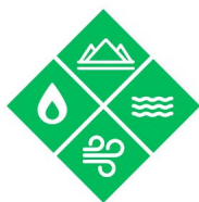
Peligros naturales y provocados por el cambio climático

Se utilizan muchos enfoques para describir los peligros y los riesgos, como los económicos, medioambientales, geopolíticos, sociales o tecnológicos. Las autoridades educativas consideran útil adoptar un enfoque de todos los peligros que abarque los peligros naturales, tecnológicos, biológicos, sanitarios, de conflicto, de violencia y cotidianos, con el fin de ser proactivos a la hora de abordarlos.