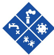
Peligros biológicos y para la salud (incluyendo pandemias)