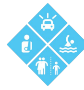
Peligros y amenazas cotidianas