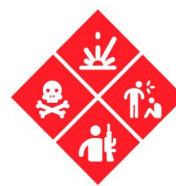
Conflicto y violencia