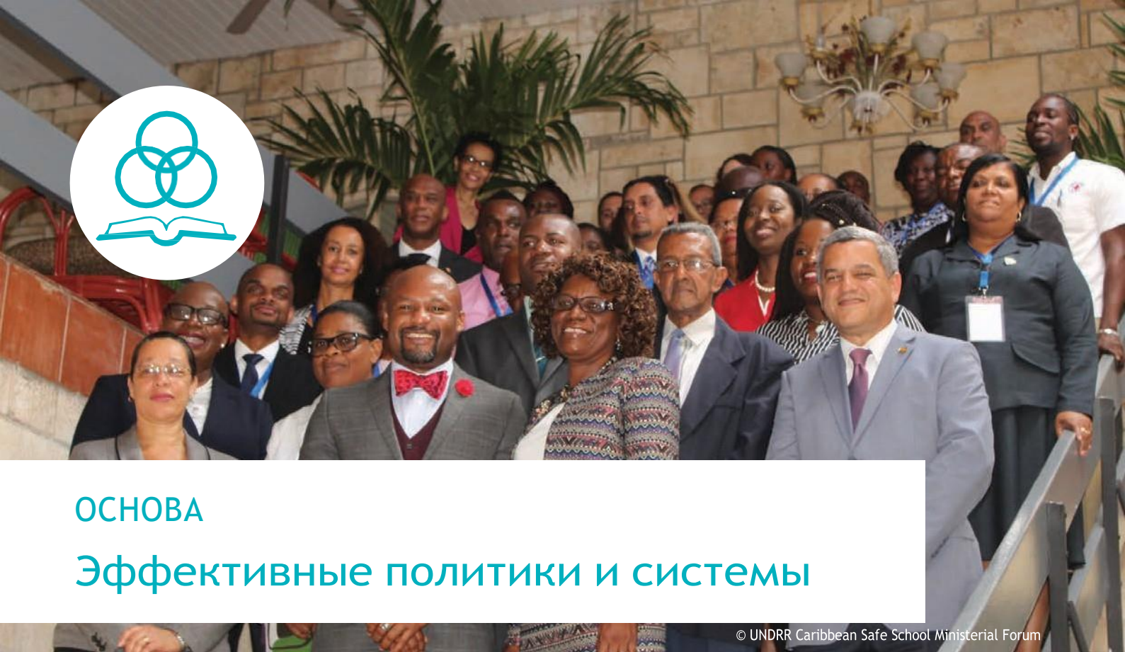
© UNDRR Caribbean Safe School Ministerial Forum